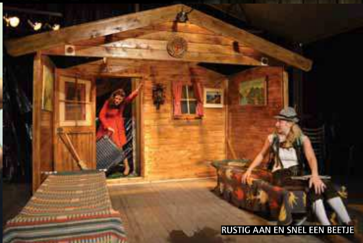
RUSTIG AAN EN SNEL EEN BEETJE